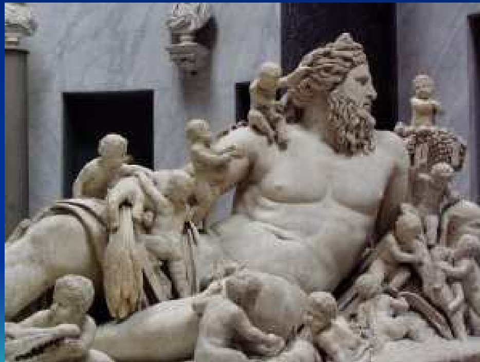
Zeus et ses enfants (Musée du Vatican)