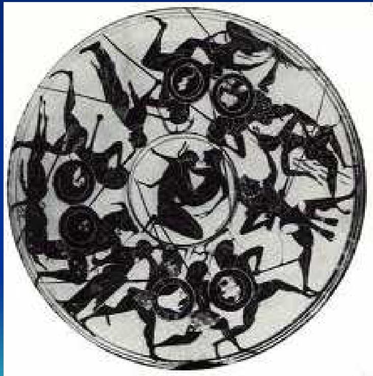
Kylix, Musée national d'Athènes