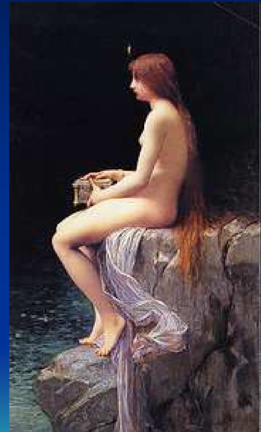
John William Waterhouse Pandore, par Jules Joseph Lefebvre