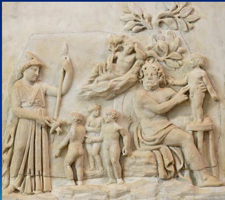
Création de l'homme par Prométhée, bas-relief romain (Musée du Louvre)